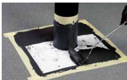
Væv trykkes fast på fladen og sidste lag QuickSeal påføres.

QuickSeal påføres i 2 lag. Der kan anvendes enten pensel, rulle eller fintandet spartel. Når første lag er pålagt, ilægges QuickSeal tagvæv, som trykkes godt fast i den våde masse. Herefter påføres andet lag QuickSeal omhyggeligt, så vævet dækkes 100%. QuickSeal er fugthærdende, hvorfor der skal regnes med en forarbejdnings tid på ca. 10 minutter.