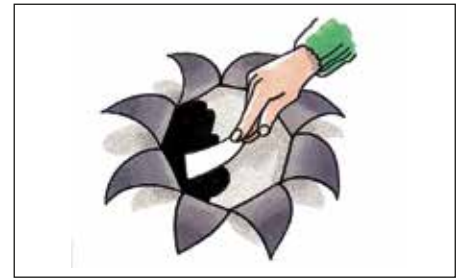
Underlaget skal være helt tørt, før der påføres Icopal Tagkit.