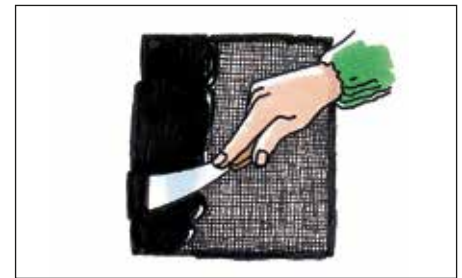
Der påføres to lag Tagkit. I det første, våde lag lægges et stykke væv, hvorefter sidste lag påføres.