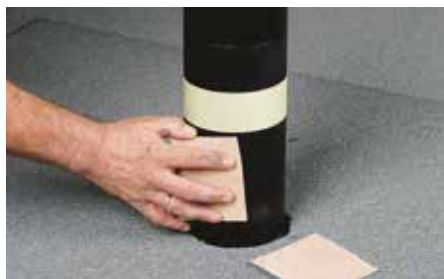
Metaloverflader afrensnes med stålborste eller sandpapir.

ICopal QuickSeal er en opløsningsmiddelfri, fugthærdende polymertætningsmasse, som anvendes til alle svært tilgængelige tætningsopgaver, inddækningsopgaver og reparationer på f.eks. tagpap-, eternit- og ståltag. Anbefales ikke anvendt på bl.a. glas, Decra Elegance og blødgjort PVC, hvor vedhæftningen er begrænset. Efter hærdning er materialet elastisk og kan modstå mindre bevægelser i underlaget.