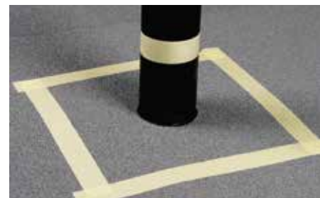
Afdækningstape sættes rundt om det område, der skal behandles. Fjern tape igen, mens massen stadig er våd.