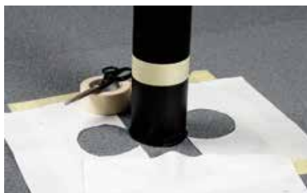
Armeringsvæv tilpasses den aktuelle gennemføring.

Overfladen rengøres. Mos bortfejes, og alger fjernes med et egnet middel.