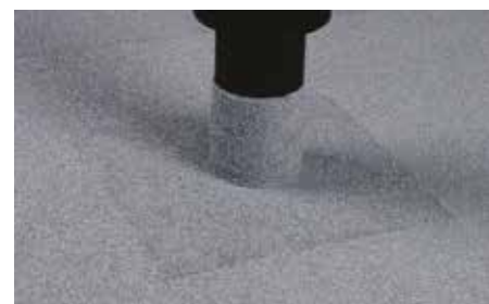
På tagpaptage kan der med fordel, umiddelbart efter afsluttende påføring, udstrøs løs skifer i tætningsmassen.