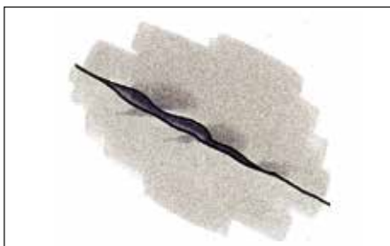
Revner sømmes til, og der påføres Tagkit og væv som under buler.