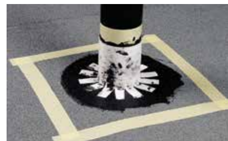
QuickSeal påføres rør og lidt ud på fladen. Væv trykkes fast. Herefter påføres QuickSeal på hele fladen. Beregn, at ca. 2/3 af forbruget anvendes hertil.