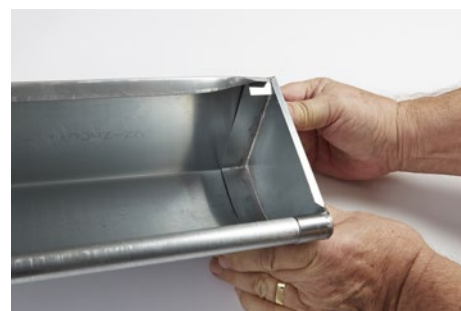
Presses på plads inden bagkant bliver bukket tilbage.