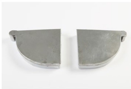
Endebund - højre og venstre.