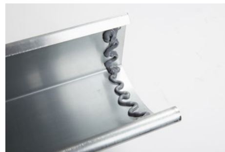
Limning af tagrende inden påmontering af endebund.