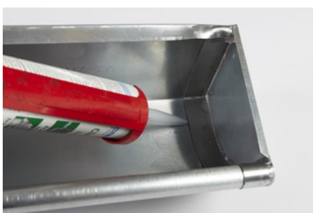
Fuges indvendig i kanten.