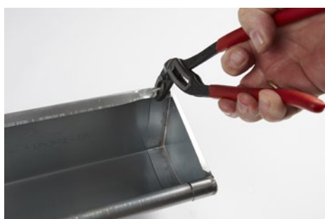
Bagkant bukket tilbage og låser endebund fast.