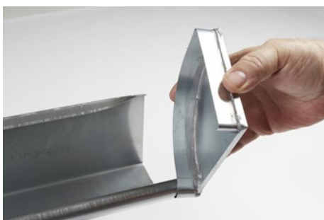
Endebund drejes rundt og på plads.