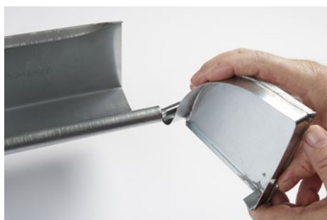
Endebund drejes ind i vulst.